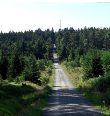
Aufstieg zum Haidel